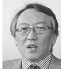
か りゅう 柯 隆

1959年山梨県甲府市生まれ。1981年中央大学法学部政治学科卒。NHKに入局し、福島・青森両放送局記者を経て報道局政治部記者。中曽根総理番を手始めに政治取材に入り、法務省、外務省、防衛省、与野党などを担当。首相官邸キャップ、政治部デスクを経て2001年から解説委員。2006年より12年間「日曜討論」キャスターを担当。2018年に解説副委員長から現職の名古屋拠点放送局長に転じる。